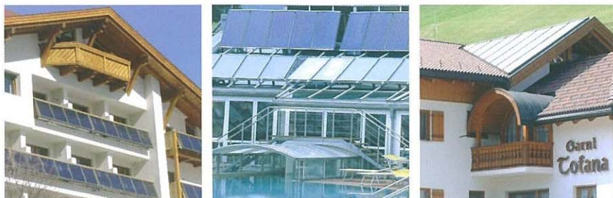
Bilder v.l.n.r.: Familienhotel Adler, Kurzentrum Bad Häring, Garni Tofana

Eine gute Planung und die richtige Dimensionierung der Anlage sind zentral für einen wirtschaftlichen Betrieb einer Solaranlage. Berücksichtigen Sie bei der Planung aber auch das große Einsparpotenzial einer guten Wärmedämmung des Gebäudes.